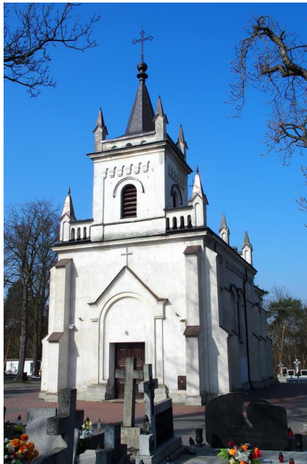
Widok od południowego - wschodu